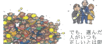
でも、選んだ人がいつも正しいとは限りません。

それをみんながちゃんとみて、間違った方向に行こうとするときは正さなければなりません。